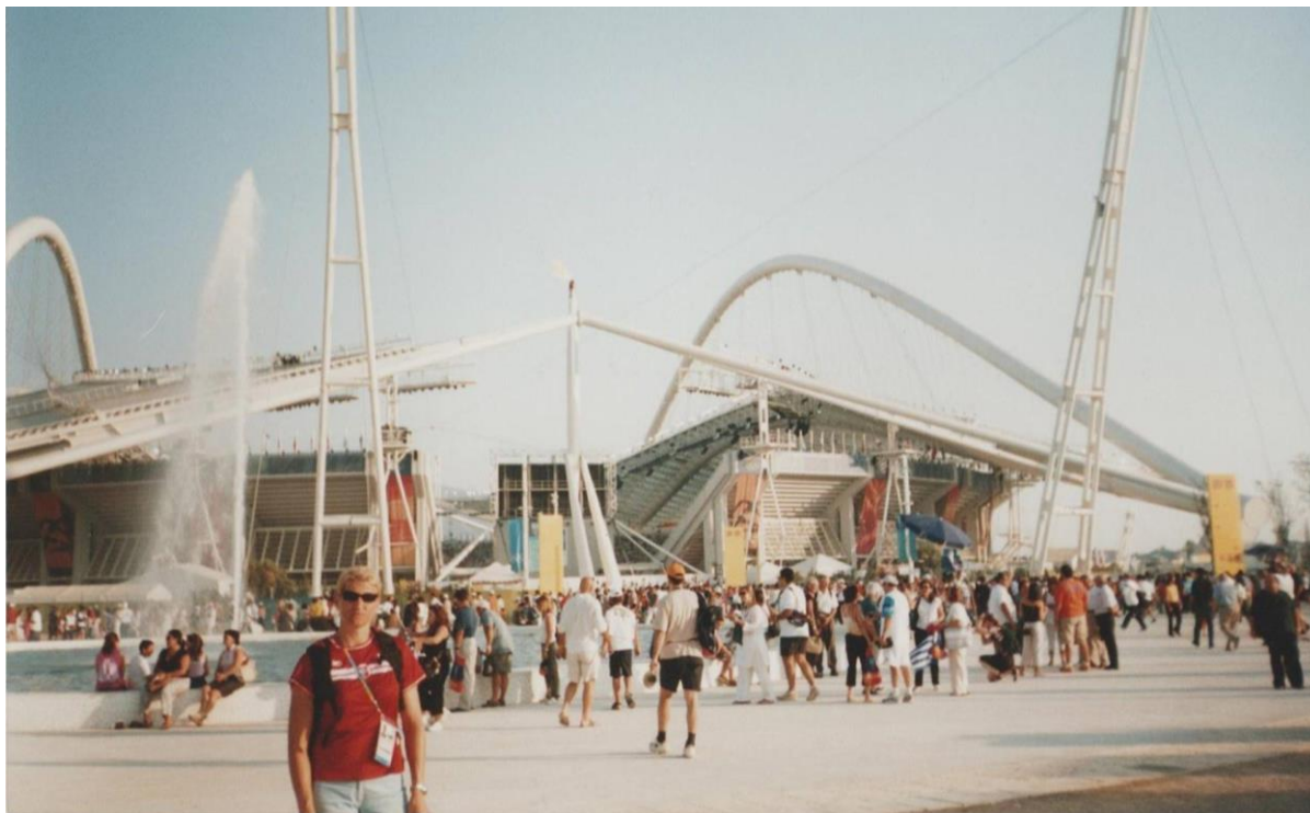
Fot. nr 260. Tutaj zaś Krystyna Zabawska prezentuje się na tle olimpijskiego stadionu.